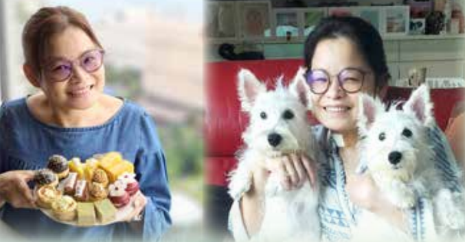
記者：鄭元沁、胡幸欣